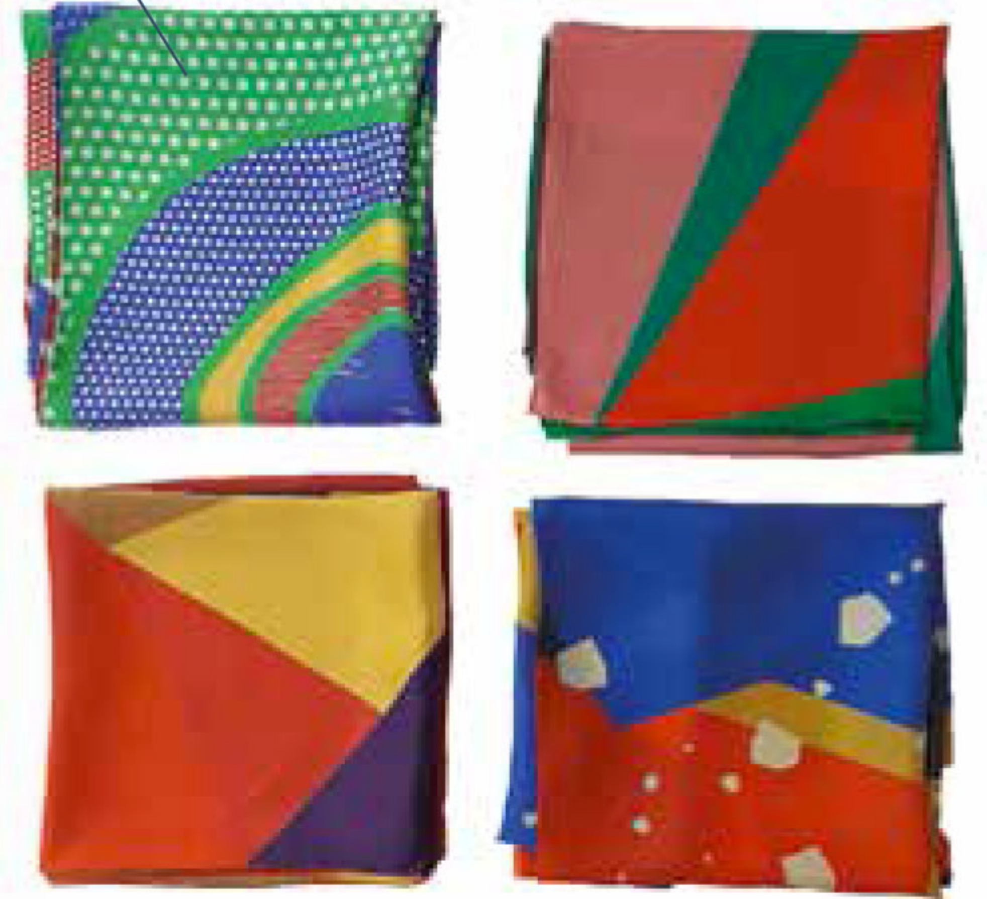
Foulards en soie des Canuts de Lyon. Papier Merveille , à partir de 120 €.