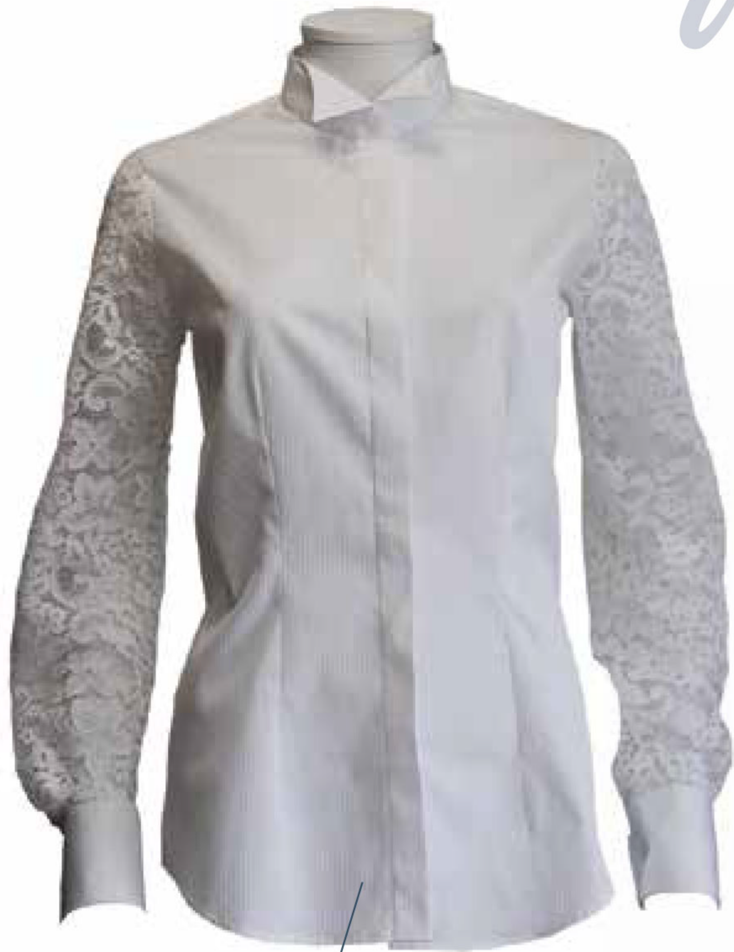
Chemise blanche Luxury. Empreinte-moi , env. 280 €.