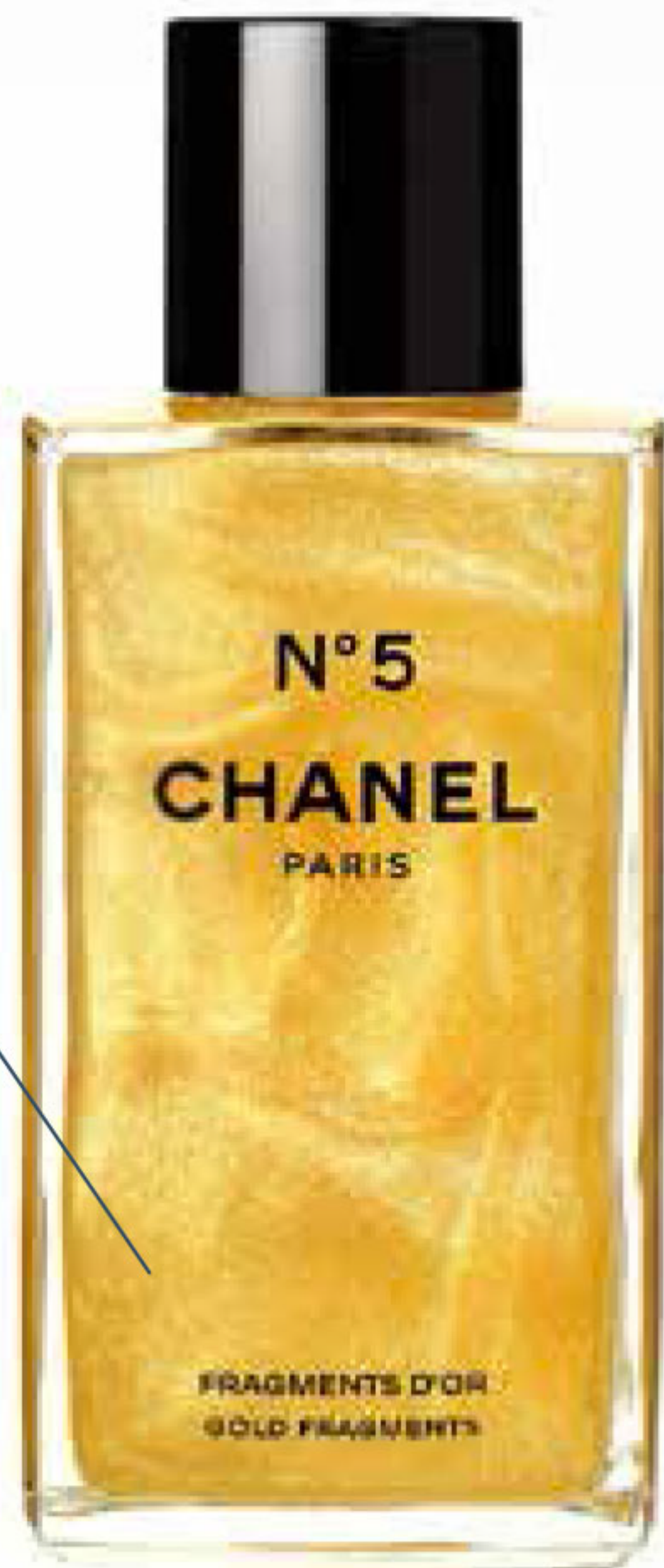
Gel N°5 Fragments d'or. Chanel , env. 85 €.